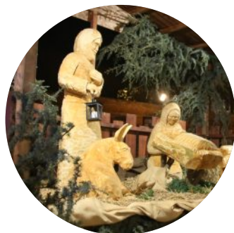
ilustrační foto (Betlém Slavkov u Brna)