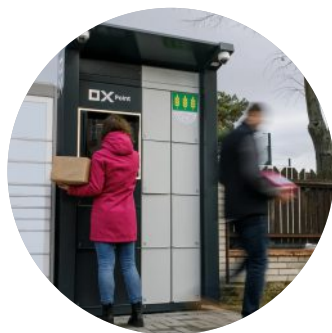
ilustrační foto (www.promestaobce.cz)

V následujícím roce bychom chtěli do obce pořídit chytrý box na poštu a zásilky. Součástí boxu by byla i digitální úřední deska, díky čemuž by byly veškeré informace přehlednější. Na tento box budeme podávat dotaci. V případě zamítnutí dotace, nebudeme schopni box pořídit. Místo, kde box bude umístěn je ještě v diskusi, ale jednáme o 2 místech. U obchodu na pravé straně, či zezadu zastávky.